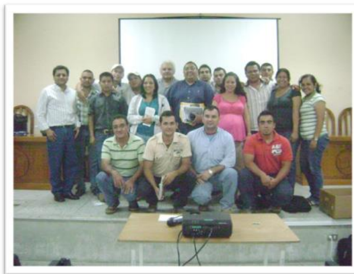
FIGURA 10. Grupo de extensionistas de Chiquimula capacitados en el cultivo de frijol.