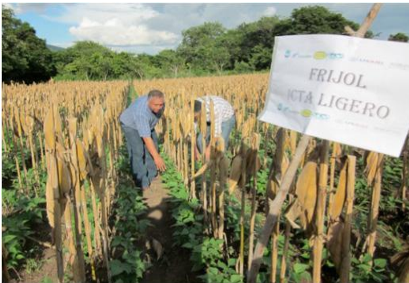
FIGURA 29. Plantación de frijol ICTA Ligeró en Aldea Los Ranchos, Quezada, Jutiapa

29). Dicho agricultor sembró el 15 de septiembre de 2011. En esta comunidad se encuentran 63 beneficiarios.