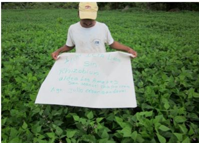
FIGURA 27. Parcela de frijol sin Rhizobium.

la formación de nódulos, en las parcelas tanto inoculada como en la no inoculada. Ver figuras 26 y 27.