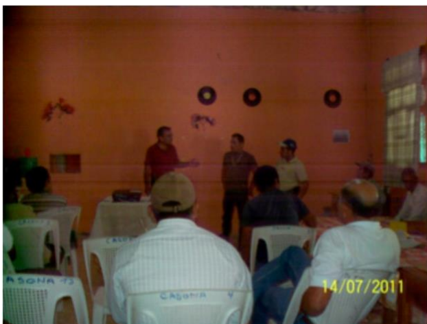
FIGURA 7. Intercambio de experiencias entre Agricultores y técnico del ICTA en la Concordia, Jinotega, Nicaragua