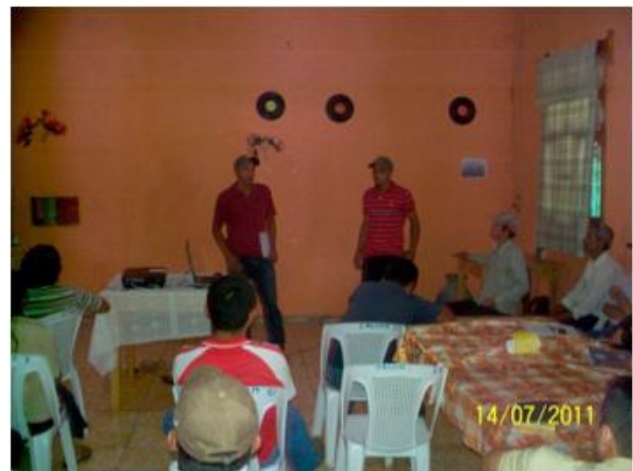
FIGURA 6. Experiencias compartidas por Agricultores en Jinotega, Nicaragua