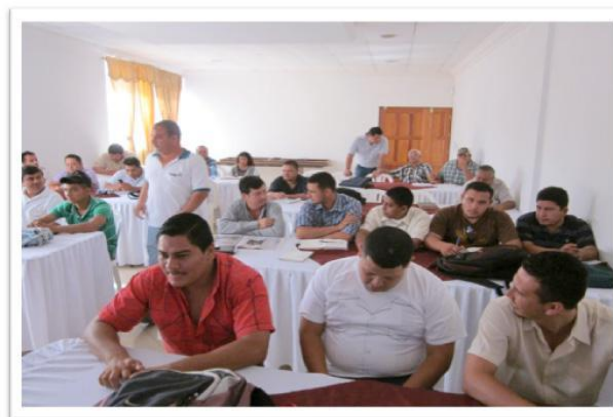
FIGURA 19. Extensionistas Agrícolas de diferentes municipios del departamento de Petén.

Libertad y Sayaxché; además se invitó al personal técnico asignado a la sede departamental del Ministerio de Agricultura Ganadería y Alimentación. (Ver figura 19).