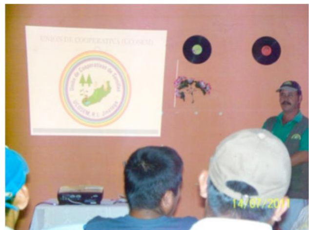
FIGURA 7. Experiencia de la Unión de Cooperativas productoras de semillas (UCOSEM), Jinotega, Nicaragua