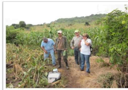
FIGURA 14. Parcela de frijol en la comunidad La Esperanza, Ipala, Chiquimula.