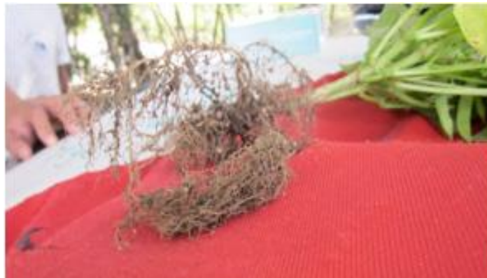
FIGURA 26. Nodulación en raíces de frijol inoculado con Rhizobium

También se pudo observar la parcela testigo sin aplicación de Rhizobium y bajo el manejo que siempre le ha dado el agricultor. No se pudo observar una diferencia significativa en