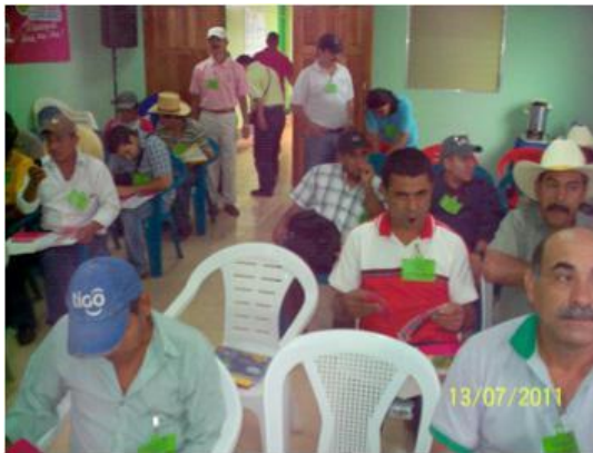
FIGURA 1. Agricultores y técnicos participantes en Mazatepe, Masaya.

de bancos comunitarios de semilla, con la participación de algunos agricultores que conforman dichos bancos. También se visitó una plantación de frijol de uno de los bancos comunales de la zona y se realizó una plenaria antes de la clausura del evento. Ver figuras 1, 2, 3 y 4.