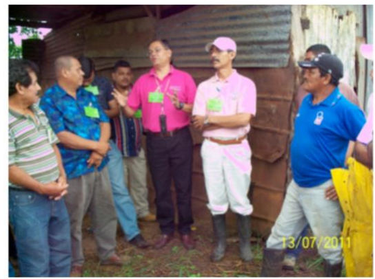
FIGURA 4. Intercambio de experiencias de campo entre agricultores y técnicos.