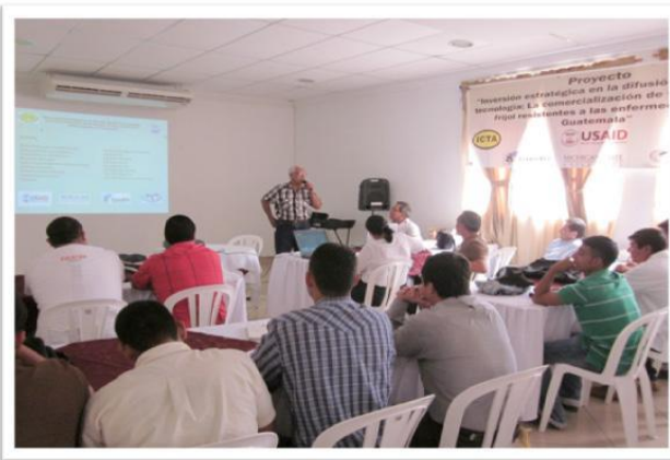
FIGURA 18. Inauguración de la capacitación del frijol ICTA Petén, por el viceministro de Petén.

La capacitación sobre el manejo agronómico del cultivo del frijol, estuvo dirigida a los extensionistas agrícolas de la Sub Dirección Rural de extensión Rural de los municipios de San Luis, Poptún, Dolores, La