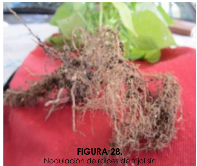
FIGURA 28. Nodulación de raíces de frijol sin inoculación de Rhizobium.