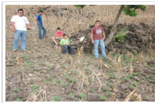
CUADRO 4. Datos generales de la parcela de frijol en Los Cimientos, San José la Arada, Chiquimula.