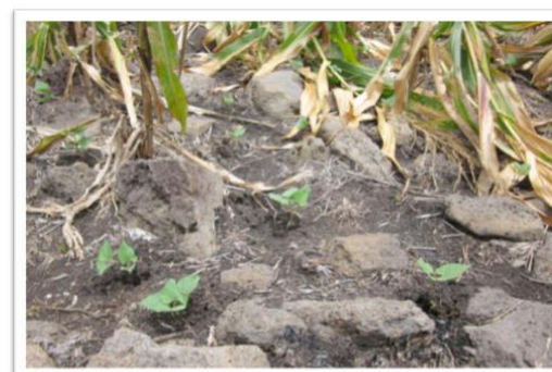
FIGURA 15. Parcela de frijol en la comunidad La Coronada, Ipala, Chiquimula.