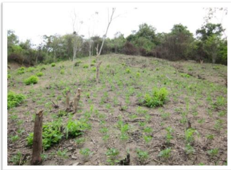
FIGURA 13. Terreno con frijol en la comunidad de Maraxcó, Chiquimula, Chiquimula (nótese el alto grado de pendiente=53%).