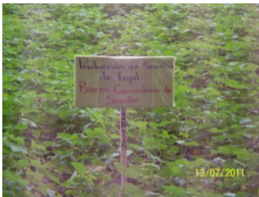
FIGURA 3. Plantación de frijol en uno de los bancos Comunales de la zona.