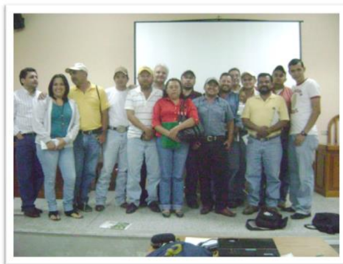
FIGURA 9. Grupo de extensionistas de Jalapa capacitados en el cultivo de frijol.

Chiquimula se capacitó a los extensionistas de Chiquimula y Jalapa. En el departamento de Jutiapa se capacitó a los extensionistas de Jutiapa y Santa Rosa. Ver figuras 9 y 10.