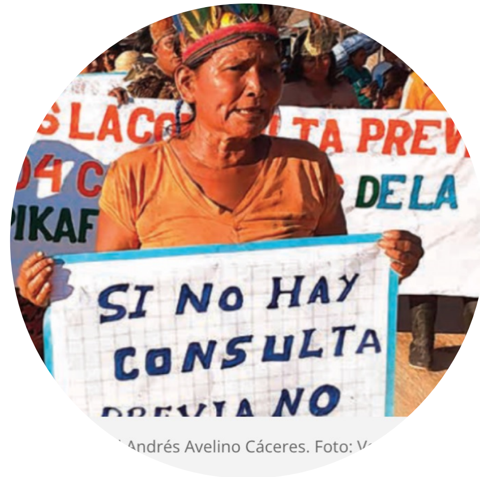
Andrés Avelino Cáceres.